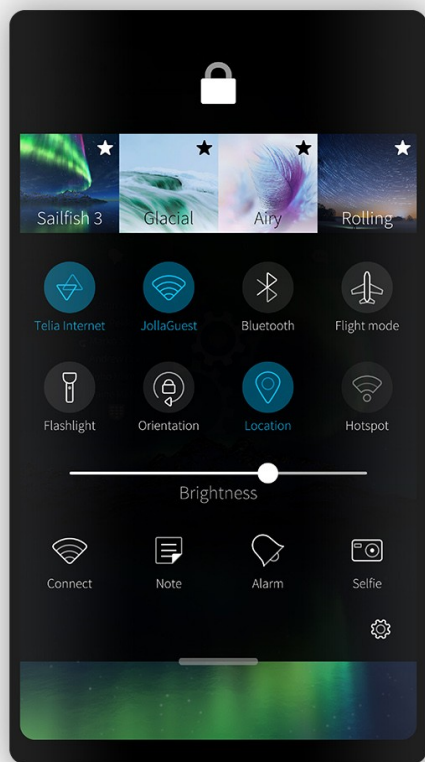
New Top menu