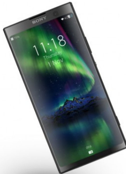
Sony Xperia XA2 Plus