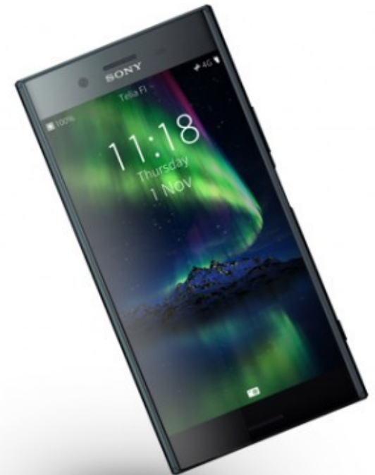
Sony Xperia XA2 Ultra