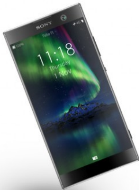
Sony Xperia XA2